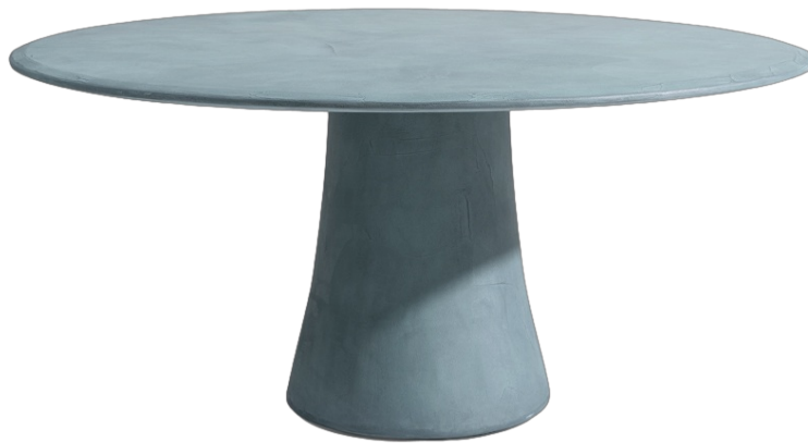
NOA / TABLE RONDE, Marco Acerbis

La table Noa se caractérise par des formes sinueuses qui créent un effet dynamique et captivant, enrichies par une finition en résine spatulée qui ajoute une agréable matérialité aux surfaces. La table Noa devient ainsi une présence sculpturale et suggestive, capable de valoriser chaque environnement dans lequel elle est insérée.